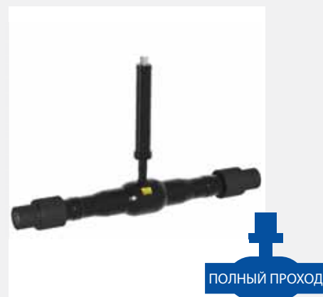
КШГ Серия 45/55, DN 32–300, PN 1,0 / 1,6 МПа